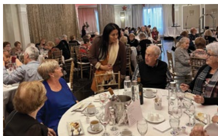
C'est toujours un grand plaisir de participer au dîner de Noël du Carrefour Montrose!