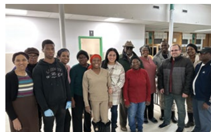
Un coup de main pour la distribution alimentaire du Centre communautaire adventiste La Fontaine