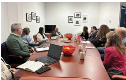
Table ronde sur l'emploi avec Randy Boissonnault, ministre de l'Emploi et du Développement de la main d'œuvre. Merci à tous les participants!